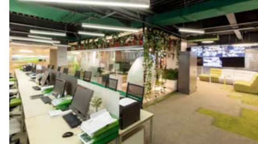
Столы сотрудников компании, фрагмент зоны ожидания и зимнего сада.