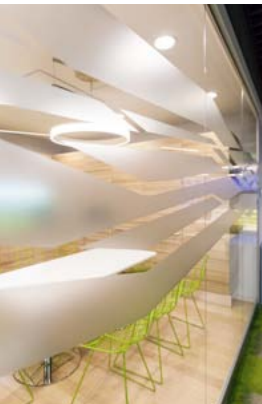
Кухня-столовая: стулья Leaf фабрики Agreer. На стекло нанесена матовая пленка.