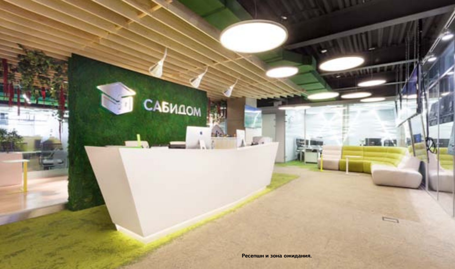
Ресепшн и зона ожидания.