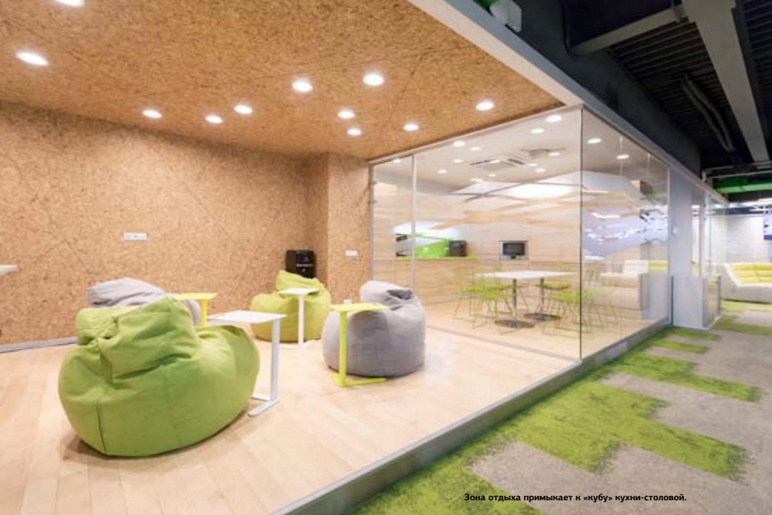
Зона отдыха примыкает к «кубу» кухни-столовой.