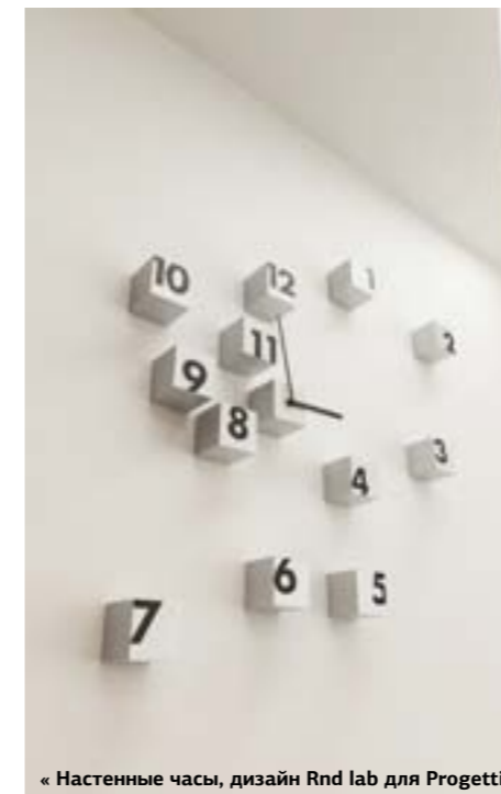
« Настенные часы, дизайн Rnd lab для Progetti.